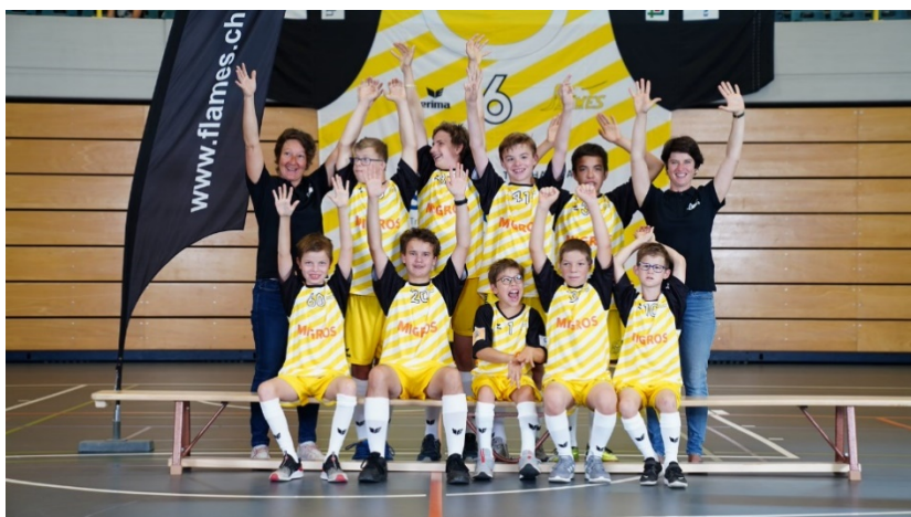
Special Flames Kids

Schon bald ein ganzes Jahrzehnt gibt es die Special Flames. Sie wurden in dieser Zeit fester Bestandteil der Jona-Uznach Flames. Heute wird in zwei Mannschaften trainiert: einer für Kinder und einer für erwachsene Spieler.